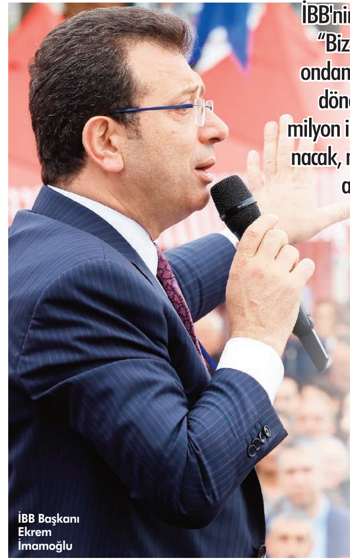
İBB Başkanı Ekrem İmamoğlu

İstanbul'un her ilçesine eşit davranarak hizmetlere devam edebileceklerini kaydeden İmamoğlu, "Bu memleketin her belediye başkanı bizim. Bu memleketin kaymakamı, bu memleketin valisi, devletin memuru da bizim. Ayırmaya çalışılanları tipiş tipiş evine yollayacağız" dedi.