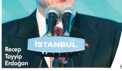
Recep Tayyip Erdoğan

Cumhurbaşkanı Erdoğan, İstanbul Finans Merkezi'nin açılışında konuştu. Erdoğan "IFM yeri ve yabancı finans kuruluşlarının bölgede faaliyet göstermeye başlamasıyla ekonomimize ciddi katkılar sağlayacaktır" dedi. "300 milyar dolar getireceğim" vaadinde bulunan Kılıçdaroğlu'nu eleştiren Erdoğan, "Tefecilerle görüştü, anlaştı, onlara sözler verdiler. 20 yıl başkanlık, cumhurbaşkanlığı yaptım. Böyle bir safata, hile dünyanın hiçbir liderinde görmedim" dedi. 1 SAYFA 9