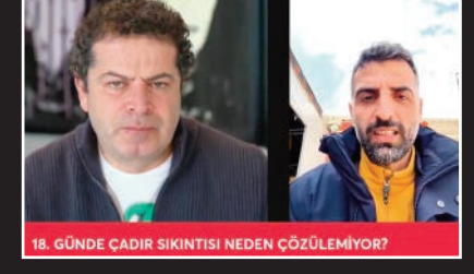
18. GÜNDE ÇADIR SIKINTISI NEDEN ÇÖZÜLEMİYOR?

talebi geldi. Mersin'e, Ankara'ya, Antalya'ya giden insanlar da çadır bulursa memleketerine dönmek istediğini söyledi. Dolayısıyla imkanı olan herkes çadır göndermeli" diye konuştu. ANIL BODUÇ