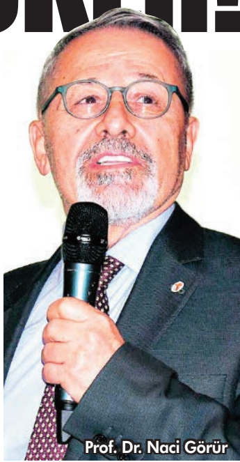
Prof. Dr. Naci Görür

Türkiye'nin önde gelen deprem bilimcilerinden Prof. Dr. Naci Görür, yine önemli uyarılarda bulundu. Katıldığı bir TV programında İzmir ve İstanbul'a dikkat çeken Görür, Marmara depreminin bölgedeki ekonominin çarklarını durduracağını söyledi. "İş dünyası biz depreme hazır değil" diyen Görür, "Marmara bölgesi üretim, sanayi ve ticaretin yüzde 60'ı ve daha fazlasını kapsıyor. Bu çarklar durduğu zaman, 10 seneye kendine getiremezsiniz. Türkiye ekonomik olarak diz üstü çöker. Çünkü ekonominin beyni, atardaman Marmara bölgesi. Türkiye ekonomik bağımsızlığını yitirir" diye konuştu.