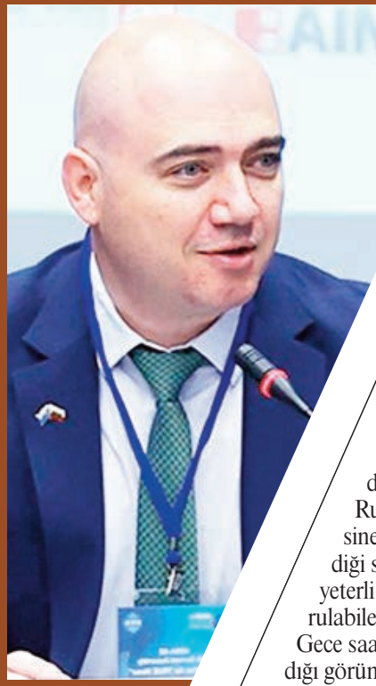
Ukrayna Devlet Başkanı Volodimir Zelenskiy