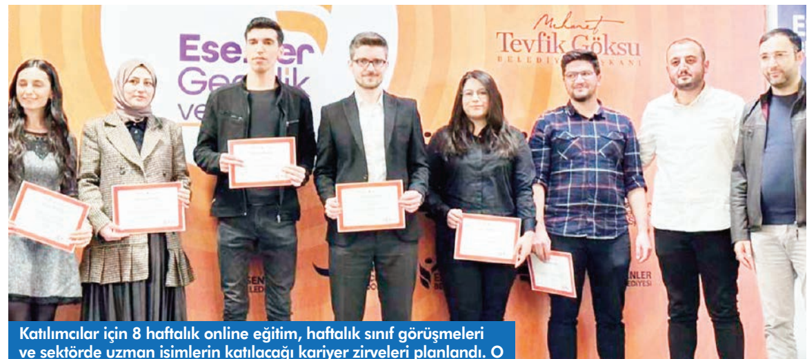
Katılımcılar için 8 haftalık online eğitim, haftalık sınıf görüşmeleri ve sektörde uzman isimlerin katılacağı kariyer zirveleri planlandı. O

findan haftalık gerçekleştirilen sınıf görüşmelerinde katılımcılar kendi projelerini sunacak, süreç içinde yaşadıkları sorunlara anlık olarak çözüm geliştirebilecek. Buna ek olarak gerçekleştirilecek kariyer zirveleri ile sektörden bilinen uzmanlardan bilgi alma imkânı da bulabilecekler. HABER MERKEZİ