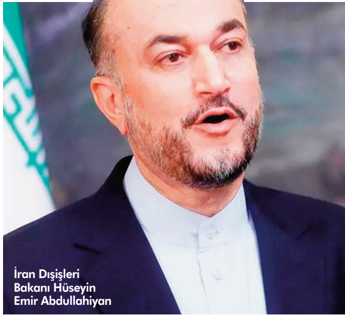
İran Dışişleri Bakanı Hüseyin Emir Abdullahiyan