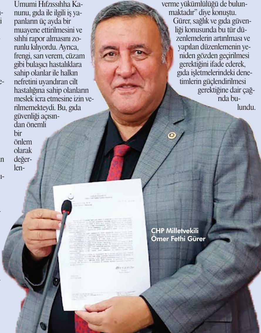
CHP Milletvekili Ömer Fethi Gürer

Gürer, sağlık ve gıda güvenliği konusunda bu tür düzenlemelerin artırılması ve yapılan düzenlemenin yeniden gözden geçirilmesi gerektiğini ifade ederek, gıda işletmelerindeki denetimlerin güçlendirilmesi gerektiğine dair çağrıda bulundu.