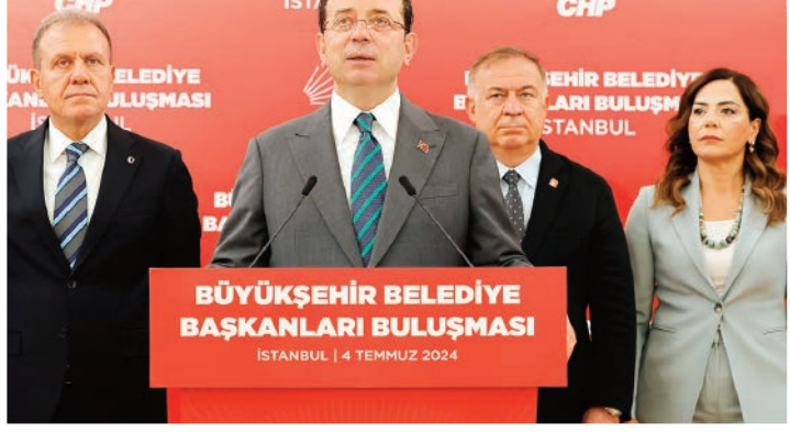
BÜYÜKŞEHİR BELEDİYE BAŞKANLARI BULUŞMASI İSTANBUL | 4 TEMMUZ 2024

CHP Genel Başkan Yardımcısı Gökan Zeybek ile İBB Başkanı Ekrem İmamoğlu, CHP'li büyükşehir belediye başkanlarıyla İPA yerleşkesinde bir araya geldi. Belediye başkanları arasında İmamoğlu, 31 Mart'ta büyükşehir, il, ilçe ve belde belediye başkanları sayısını artırdıklarını belirterek, "Vatandaşlarımız, deyim yerindeyse, 'yerel yönetimler milli takımını' CHP'li belediye başkanlarından oluşturdu ve bize, 'Çıkin sahaya, iyi oynayın ve kazanın' dedi. Biz de bunu gururla yapacağız" diye konuştu. 1 SAYFA 5