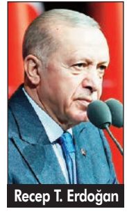
Recep T. Erdoğan

→ Cumhurbaşkanı Erdoğan, Beştepe'deki 26. Dönem Adli Yargı ve 16. Dönem İdari Yargı Kura Töreni'nde konuştu. 6-8 Ekim olaylarının davasında verilen kararları değerlendiren Erdoğan, "Bu hadise asla protesto gösterisi değil, 37 insanımızın vahşice öldürüldüğü terör kalkışmasıdır. Devlete karşı bir isyan girişiminde bulundular. 35 il 96 ilçede sokaklar dükkanlar, okullar ateşe verilmiş maddelerin kamusal alanlara akıtılmasıdır. Hukuk elbette bunlardan hesap sormak zorundadır" dedi.