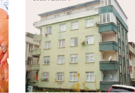
5 katlı bina

➔ Avcılar'da kolonlarında çatlak olduğu yönünde ihbar yapılan 5 katlı bina incelemenin ardından tahliye edildikten sonra mühürlendi. 5 katlı, 10 daireli binada bulunan 6 dairede oturan 22 kişi gidecek yerleri olmadığını bildirince otele yerleştirildi. Diğer 4 dairedeki 11 kişi yakınlarının evine gitti. Binanın riskli olduğuna dair alttaki iki iş yeri sahibine de ulaşılarak bilgi verildi. Binanın bodrum katını depo olarak kullanan Erhan Yıldız, "Binada bir sıkıntı yok. Komşumuz korkmuş" dedi. | SAYFA 4