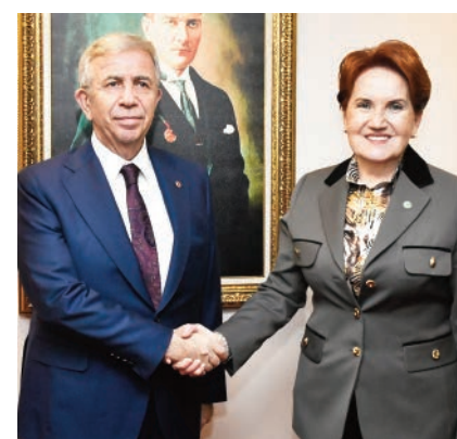
ABB Başkanı Mansur Yavaş, İYİ Parti Genel Başkanı Meral Akşener'i ziyaret etti. Yaklaşık 20 dakika süren görüşme sonrası açıklama yapan Yavaş, "Genel Başkanımız Özgür Özel'in selamını getirdim" dedi. Yavaş, "Yerel seçimlerde bir işbirliği mi gündeme geldi mi?" sorusuna "İki partinin de yetkili kurululan var. Daha sonra parti kurulları uygun görürlerse bir açıklama yaparlar" yanıtı verdi. "İYİ Parti'den destek istediniz mi?" sorusuna da "O konulara girmedim, yetkim de yok" şeklinde cevapladı.