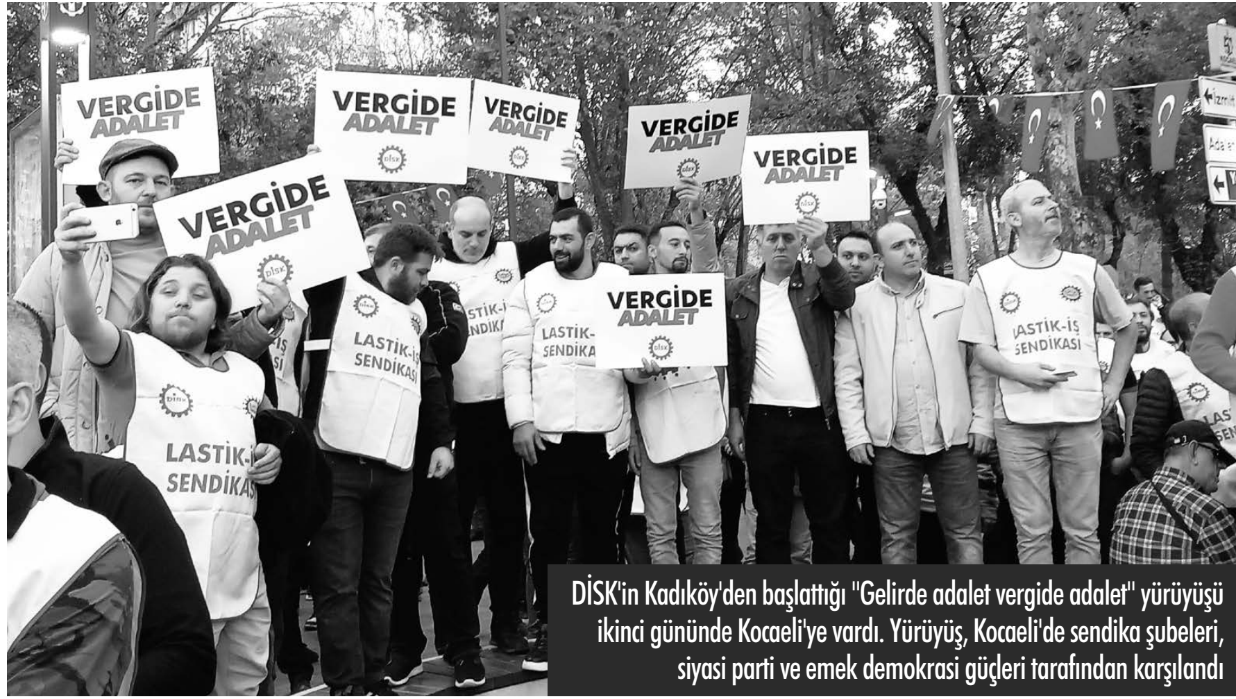
DİSK'in Kadıköy'den başlattığı "Gelirde adalet vergide adalet" yürüyüşü ikinci gününde Kocaeli'ye vardı. Yürüyüş, Kocaeli'de sendika şubeleri, siyasi parti ve emek demokrasi güçleri tarafından karşılandı