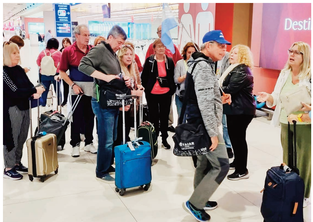
Ülkelerinden ayrılmak isteyen başta İsrail vatandaşları olmak üzere, Türkiye uçuşlarına yoğun talep var. Ancak THY akşam saatlerinde Tel Aviv uçuşlarına ikinci bir bildiriye kadar ara verildiğini duyurdu.