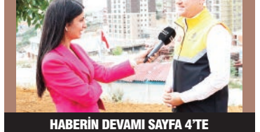
HABERİN DEVAMI SAYFA 4'TE