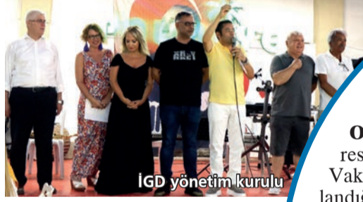
İGD yönetim kurulu