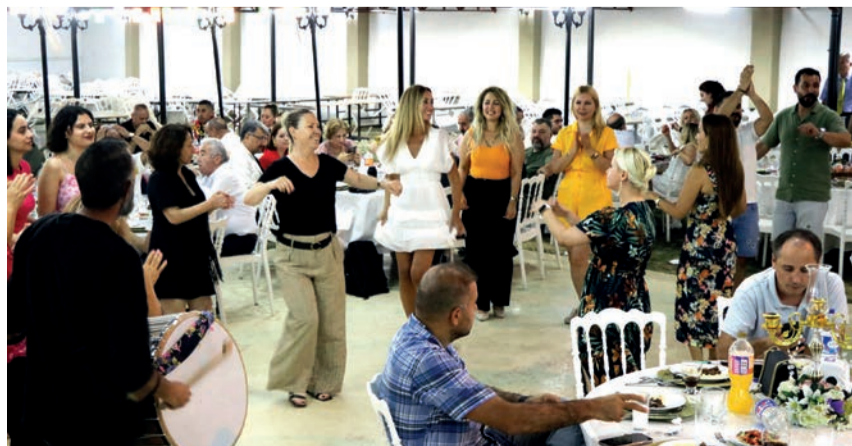
Yapılan konuşmaların ardından etkinlik, Silivri Belediyesi fasıl ekibi eşliğinde halaylar ve danslar ile devam etti. Sıcak bir yaz günü gecesinde emekçi gazeteciler gönüllüce eğlenmeyi bildi ve bir dahaki buluşmaya kadar vedalaşıldı.

Hani dünün baskıdan önce denetlenen yayıncılığında olay saniseler içerisinde denetlenen ve süzgeçten geçen yayıncılığa dayandı. Son yıllarda on binlerce gazeteci işsiz kalmış, yüzlerce yayın organı kapatılmış, bine yakın gazeteci de tutuklanmıştır. Bütün bu sorunlarla mücadele etmesi gereken muhalefet partilerinin de medyaya yönelik tutumundan farksızdır" diye konuştu.