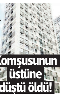
Sayfa 3 Komşusunun üstüne düştü öldü!

nemi için açıklanan yoksulluk sınırı 35 bin TL'ye dayanmış durumdadır. Belirlenen asgari ücret yoksulluk sınırının yüzde 67,3 altındadır. Öte yandan kamu işçisi ile özel sektör işçileri arasındaki uçurum devam etmektedir. Bir kez daha söylemek isteriz ki devlette ve özel sektörde farklı asgari ücret eşitlik ilkesine aykırındır" tepkisini gösterdi. | SAYFA 6