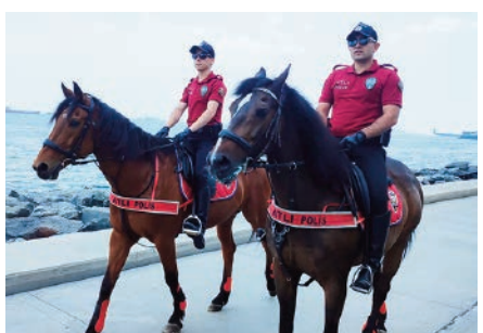
Sahillerde atlı polis denetimi