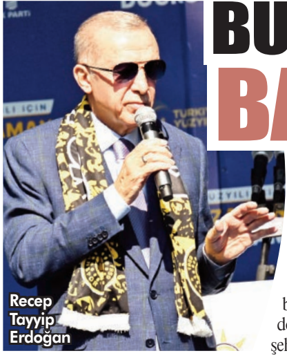
Recep Tayyip Erdoğan

İBB Başkanı Ekrem İmamoğlu'nun Erzurum mitingine düzenlenen taşlı saldırı hakkında konuşan Cumhurbaşkanı Erdoğan, "Kaybedeceklerini anladıkları için şimdiden çamura yatmaya başladılar. Her partinin temsilcisinin yer aldığı heyetlerin gazetimindeki çalışmaların üzerine sanki bunu bilmiyormuş gibi gölge düşürmeye çalışıyorlar" dedi. "Teknolojik imkanların böyle geliştiği dönemde bu numaralar bayatladı" diyen Erdoğan, "Kendi provokasyonları ile olay çıkarıp utanmadan şehirlerimizi karalamaya çalışıyorlar" ifadelerini kullandı.